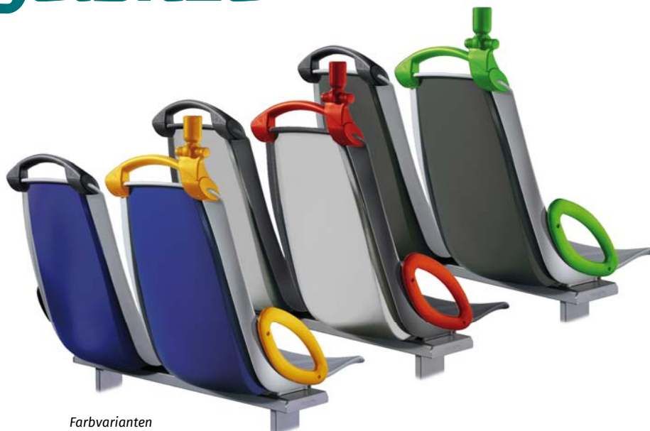
Farbvarianten Color variations